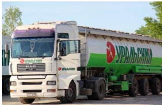
От работы транспортного отдела зависит бесперебойная деятельность всего свинокомплекса «Уральский»

Благодаря эффективной организации доставки продукция предприятия в кратчайшие сроки поступает в переработку известным крупным производителям Уральского федерального округа, включая северные регионы, а также крупным рыночным покупателям Урала и Сибири. Свинина мирового стандарта в полутушах торговой марки «Свинокомплекс «Уральский» имеет гарантированно высокое качество продукции, предназначенной для индустриального производства. Выход мяса на кости — около 75%, оно имеет минимальную степень осаливания, толщина шпика не превышает двух — двух с половиной сантиметров, беконность — более двух прослоек мяса. Приоритет компании — производство высококачественных и, что особенно важно, свежих продуктов питания — будет актуален всегда.