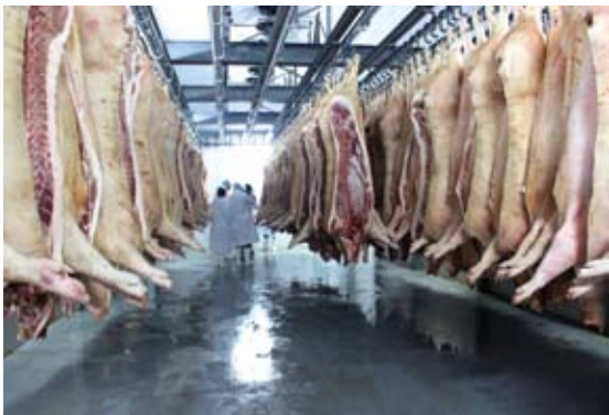
Цех первичной мясореработки. Продукция предприятия

Сегодня передовые технологии ЗАО «СК «Уральский», применяемые при производстве свинины ми-